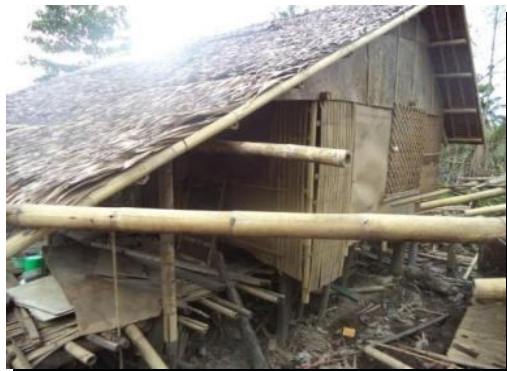
Familia de Jovimen – Altavas - Aklan, Filipinas