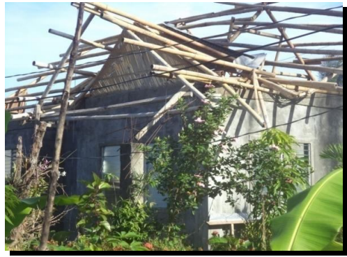
Familia de Edwin - New Washington - Aklan, Filipinas